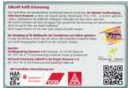
Netzwerk Erinnerung+Zukunft in der Region Hannover e.V.