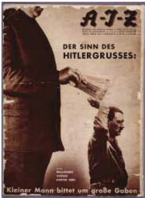
Der Sinn des Hitler-Grußes“ von John Heartfield, Titelbild der Arbeiter Illustrierte Zeitung (AIZ), (1932)