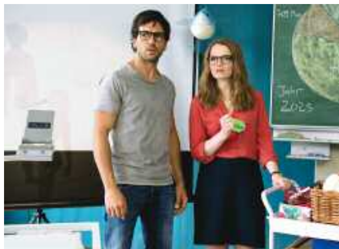
Fuck Ju Göhte 2

lich Unmögliches gelingt. Dieses Vorhaben wird auch als Projekt bezeichnet, ein Projekt der besonderen Art. Die Arbeit in dieser Form ist keine Eintagsfliege geblieben und wird bis heute fortgesetzt. Es wird zu besprechen sein, welche Gelingenspotenziale dies ermöglichen.