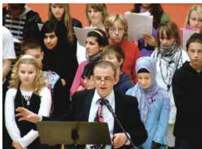
Faust II reloaded – Den lieb ich, der Unmögliches begehrt!